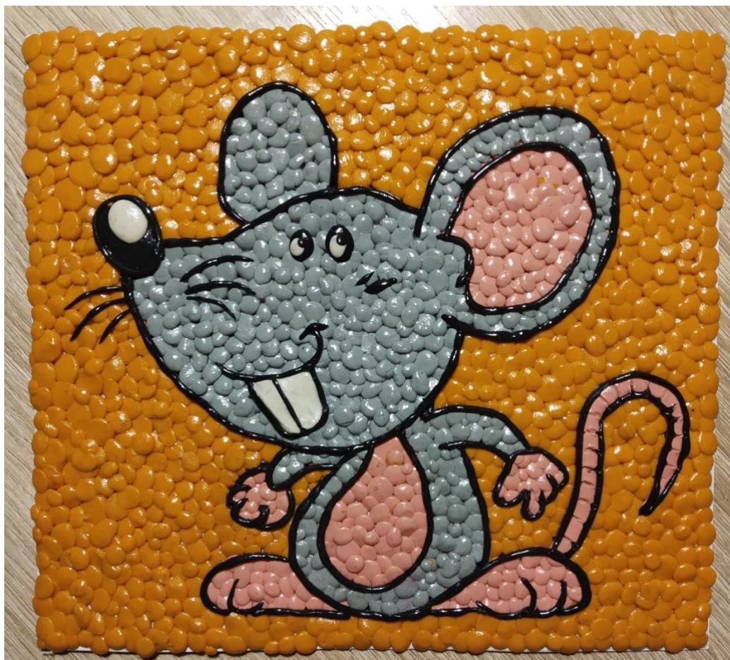
Варианты работы в данной технике.